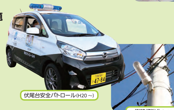
伏尾台安全パトロール(H20～)