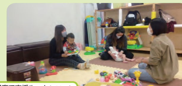
子育て支援ルーム(H22～)