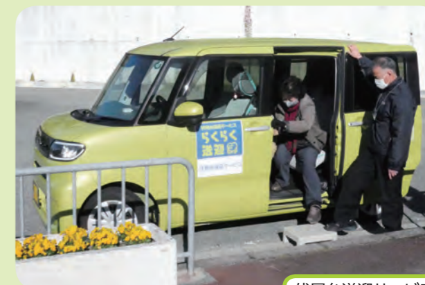
伏尾台送迎サービス(R2～)

ほそごう地域コミュニティ推進協議会(伏尾台地区) お問合せ・お申し込みは:コミプラ内の常駐スタッフまで