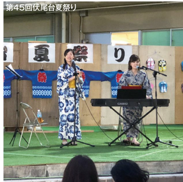
◎第45回伏尾台夏祭り: 8月24日(土)開催

「コミュニティ推進協議会」が支援しました上半期の主な活動のご報告です。地域の活性化に対する各グループの地道な活動と、ご参加していただいた住民の皆さまに感謝いたします。