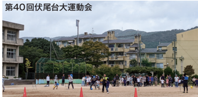
◎高齢者の居場所づくり意見会: コミプラにて随時開催

60歳以上の方を対象に、夕食をとりながら交流を深めていただき、これからのまちづくりや居場所づくりについてご意見を聞かせていただいた会合です。(※今後の予定は掲示板などの案内をご覧ください。)