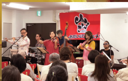
5月18日(土)：アブサント・アンサンブル/弦楽器とフルートなどによる7人編成の音楽コンサート。

素敵なお音楽が鑑賞できたり、プロの落語が生で聴けたり、30回目を迎えた「ふしおだい山びこフェスタ」の会場は、いつも満員の盛況です。(※上半期は3回開催。)