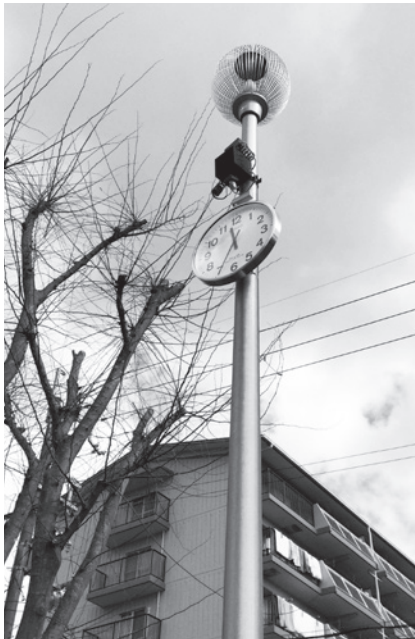
遊んでいても時間がよくわかるよう になりました。(北中央公園)