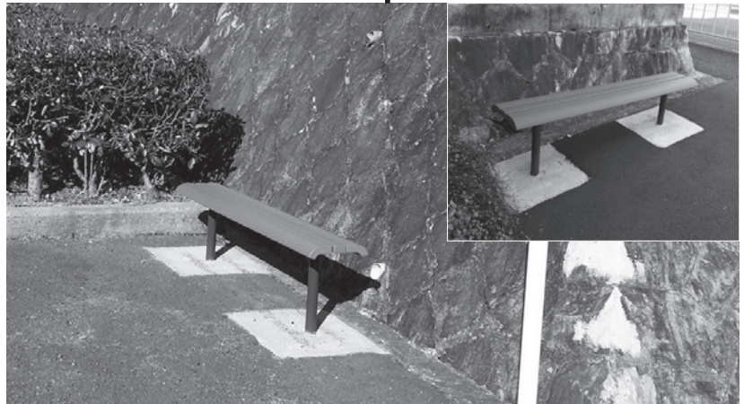
散歩の途中のご休憩や、お友達とのご歓談の場所としてご利用いただけると うれしいです！(遊歩道二カ所)