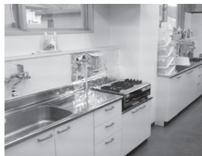
シンク、調理台が使いやすくなりました！