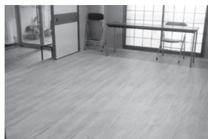
フローリング化で幅広い用途に使えます！