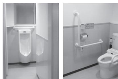
バリアフリー対応も充実しました！