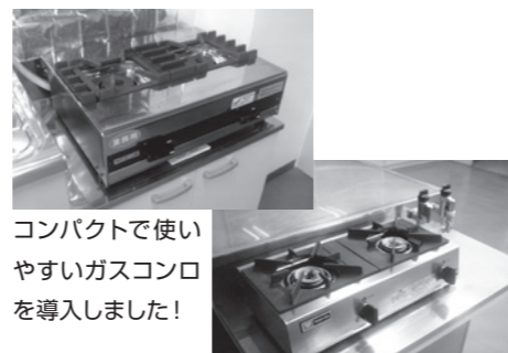
コンパクトで使いやすいガスコンロを導入しました！