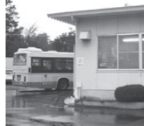
阪急バス伏尾台営業所